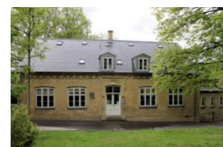
Den gamle øvelsesskole i Jonstrup, der i dag huser Jonstrupsamlingen