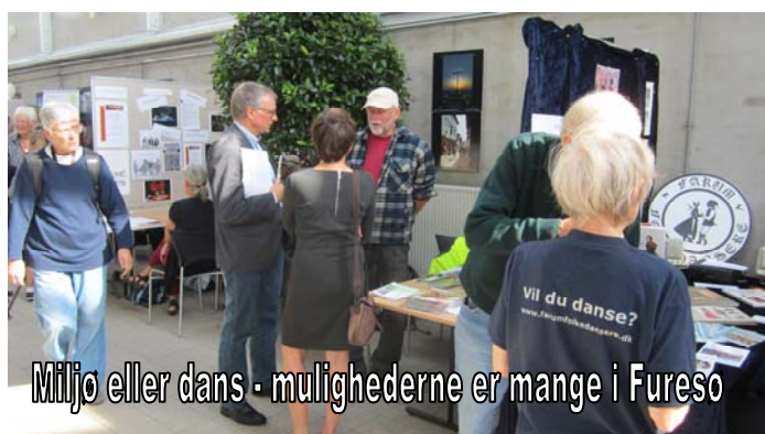
Miljø eller dans - mulighederne er mange i Furesø

Lidt senere - inden dagens gæstetaler (se senere) underholdt VISENS VENNER i ca. ½ time samme sted med flotte sange og stort bifald.