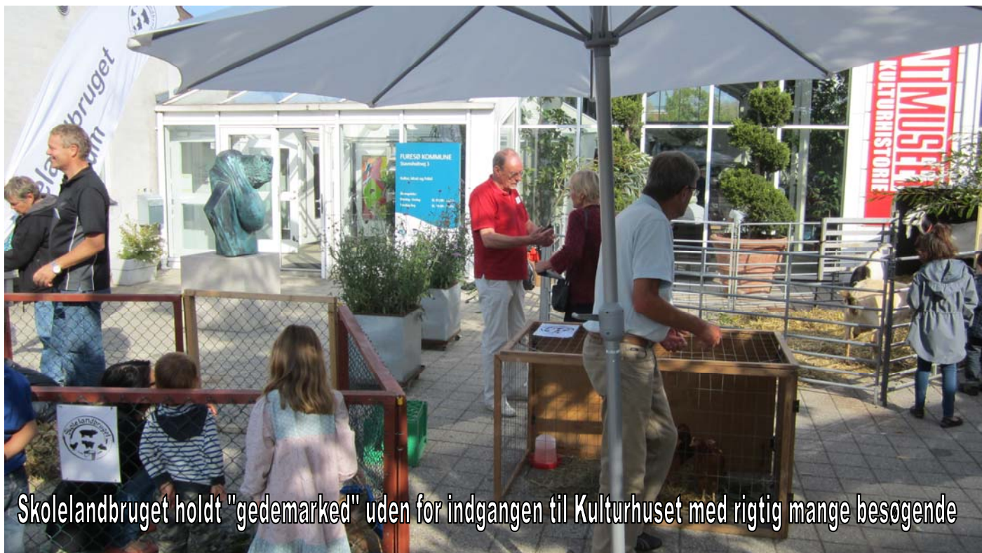
Skolelandbruget holdt "gedemarked" uden for indgangen til Kulturhuset med rigtig mange besøgende